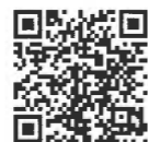
主税局HP (縦覧について)